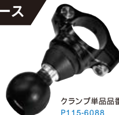
クランプ単品品番 P115-6088

車体と直接接触するボールベース部にダンパーゴムを装備し元から振動を吸収するタイプ。ホルダー自体のサイズ感に大きな変更をせずに、RAMのホールディングスタイルを保つことが可能。