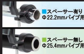
■スペーサー有り Φ22.2mmパイプ用