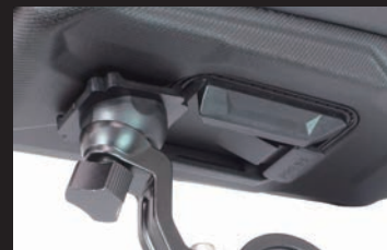
スライドロック機構を採用することで、 簡単にバッグの脱着が可能