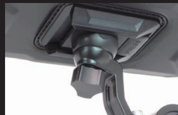
バッグ本体を自由な角度に調整できる マルチジョイント機構を採用