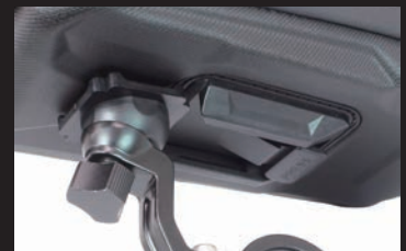
スライドロック機構を採用することで、 簡単にバッグの脱着が可能