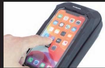
バッグからスマートフォンを取り出すこと 無く、タッチパネルの操作が可能!!