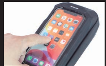
バッグからスマートフォンを取り出すこと 無く、タッチパネルの操作が可能!!