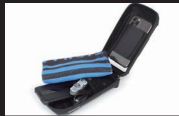
コンパクトでありながら スマートフォン・財布・バッテリーを収納