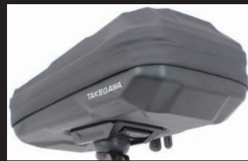
セミハード樹脂ポディーを採用