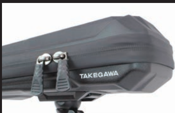
バッグのファスナーに防水タイプを採用 ファスナーからの水の侵入を防止