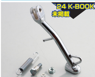
24 K-BOOK 未掲載

駐輪の際、非常に便利です。車種専用設計ですので、ボルトオン装着が可能。（一部外装パーツの加工が必要な場合があります）