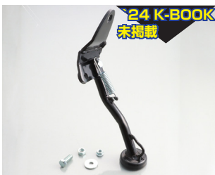
24 K-BOOK 未掲載