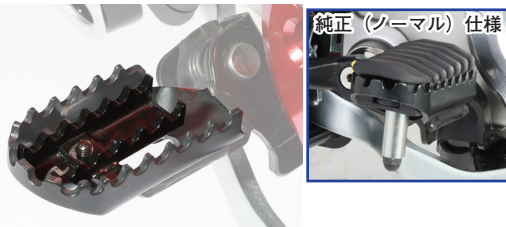
純正（ノーマル）仕様