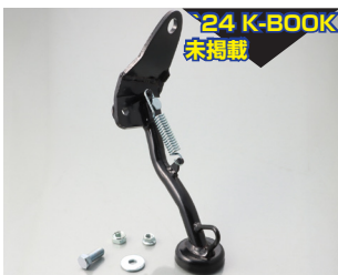
24 K-BOOK 未掲載