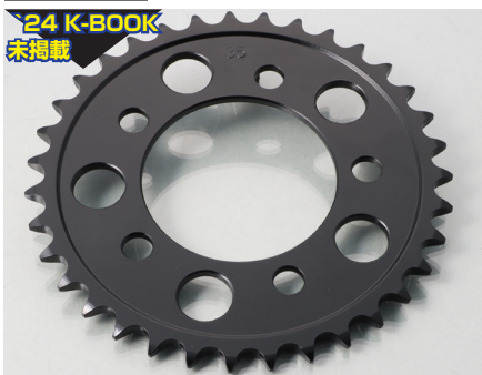
24 K-BOOK 未掲載

備考 ○ 520 サイズ ○スチール製 ※レブル 250/S (FNO,MC49-1000001 ~ 1399999) (ノーマル : 36T は T 数変更時、速度表示が狂います。またスピードパルス変換ユニットの設定無し) ※ホイールに速度センサーがある場合は、T 数変更時でも速度表示は狂いません。