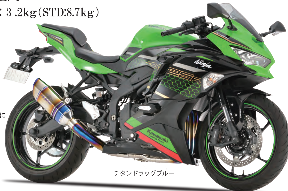
チタンドラッグブルー