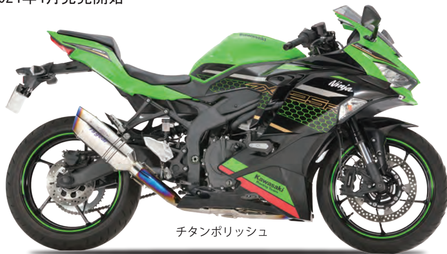
チタンポリッシュ