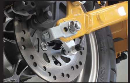
装着 (ノーマルキャリアブラケット用)