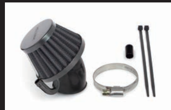
エアフィルターキット(ブラックエレメント)