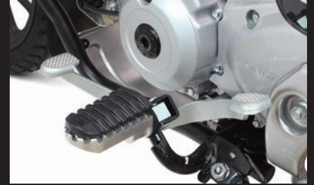
装着(クロスカブ110/ラバーステップ仕様)