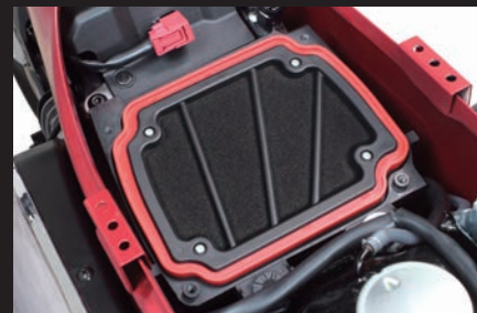
装着写真(SP武川製パワーフィルター)