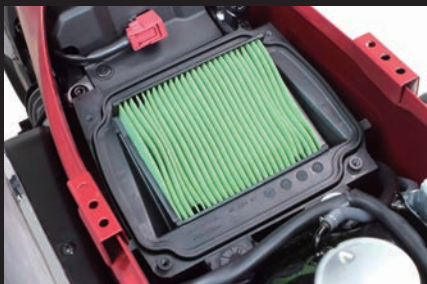
装着写真(ノーマルエアフィルター)