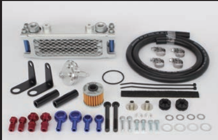
3フィン4オイルライン