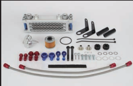
3フィン4オイルライン