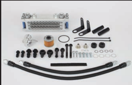
3フィン4オイルライン