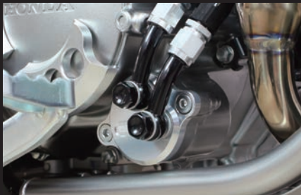
装着写真(オイル取り出し口)