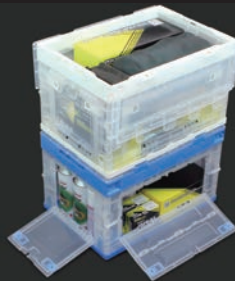
積み上げ時でも中窓から荷物の出し入れが可能