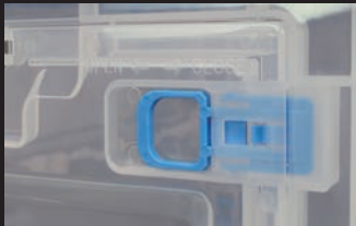
中窓部すべて スライドロック機能付き