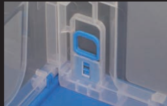
更にコンテナの内側を固定する ロック付き