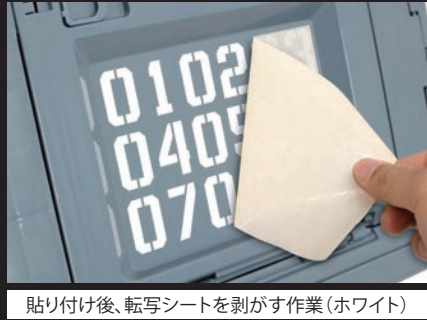
貼り付け後、転写シートを剥がす作業(ホワイト)