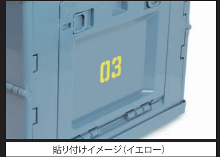
貼り付けイメージ(イエロー)