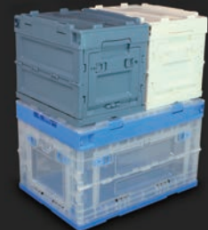
50L(1個)に20L(2個)の積み上げ可能