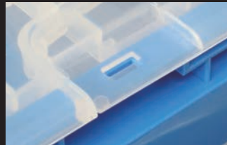
上部開口部は結束バンドなどで 簡易的なロックが可能