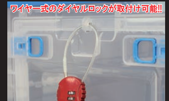
ワイヤー式のダイヤルロックが取付け可能!!