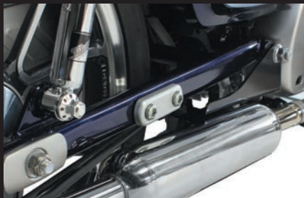
装着 (スーパーカブC125)