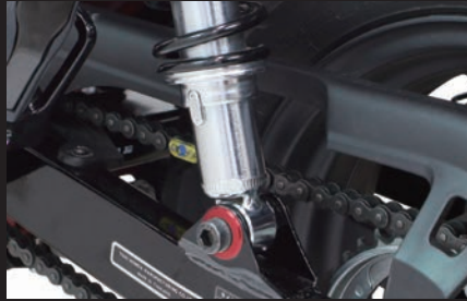
装着(プレーンタイプ/レッド)