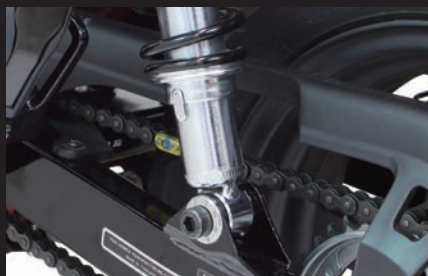
装着(8ホールタイプ/シルバー)