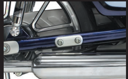
装着 (スーパーカブC125)