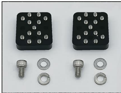
PARTS NO. 852126