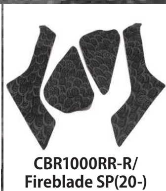
CBR1000RR-R/ Fireblade SP(20-)