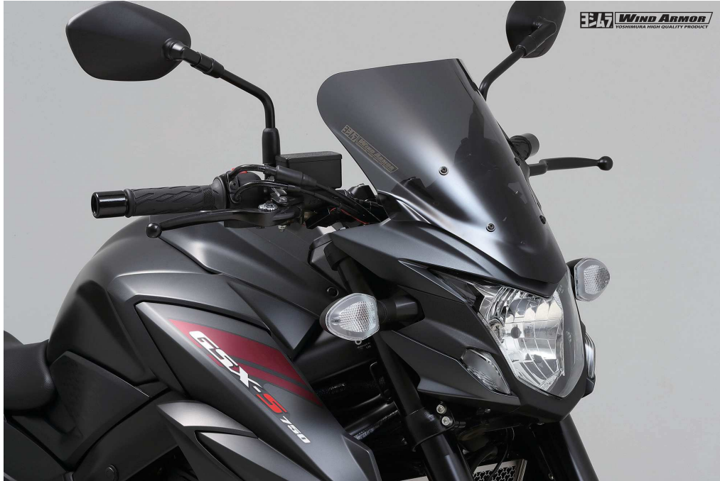
写真はプロトタイプです。