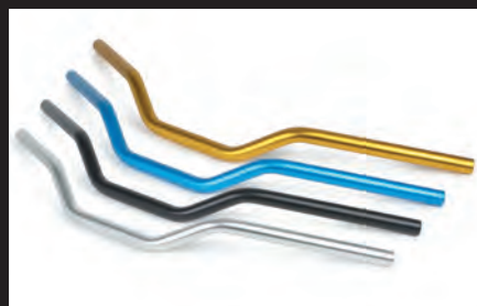
アルミステアリングハンドルパイプ(全4色)