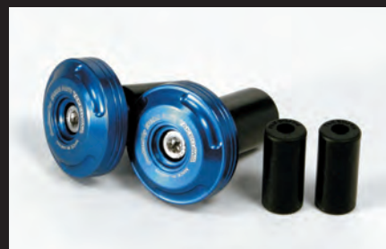
バーエンド(オプションパーツ)