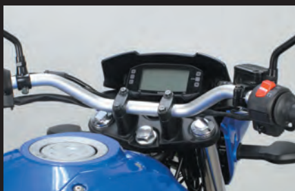
装着写真(マットシルバー)